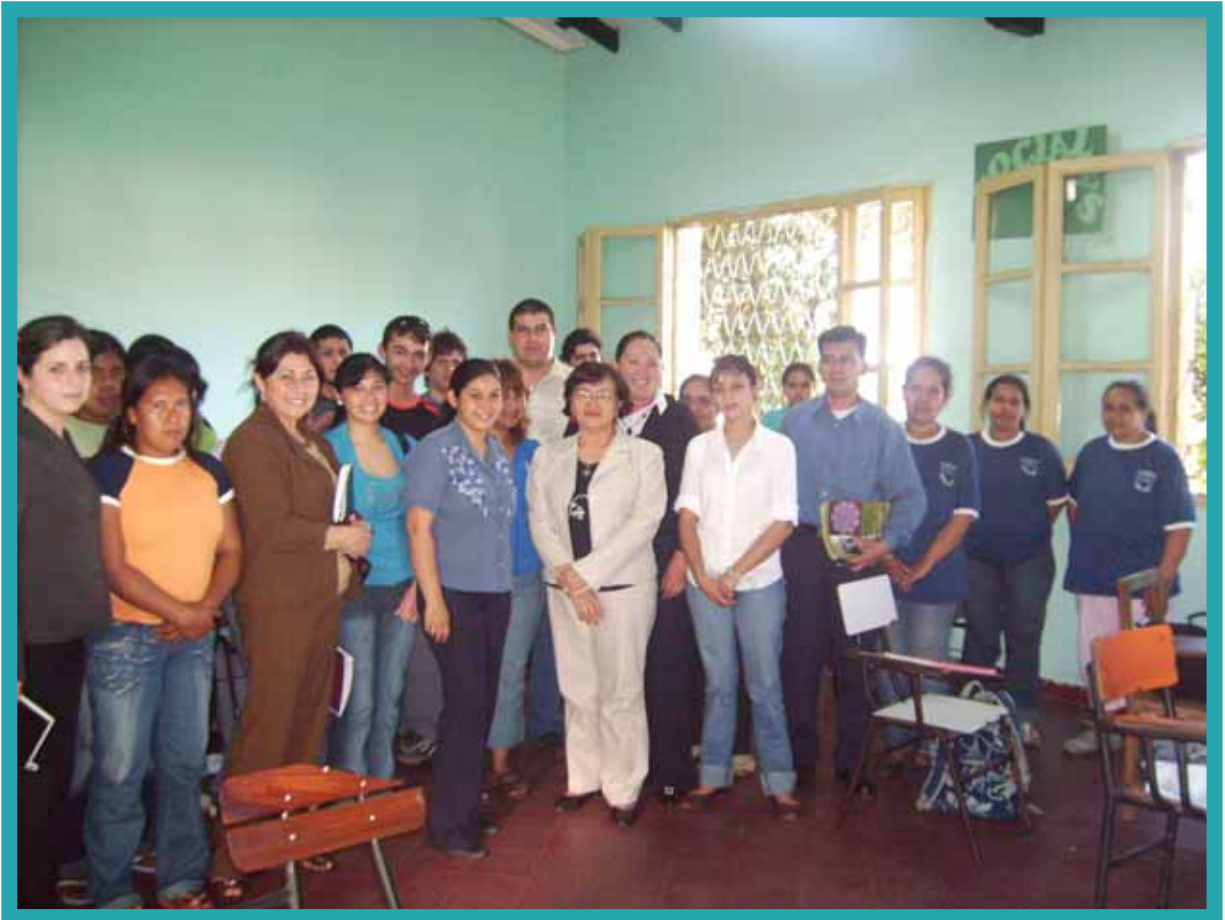
Estudiantes y profesoras de un Multiciclo de Adultos en Asunción